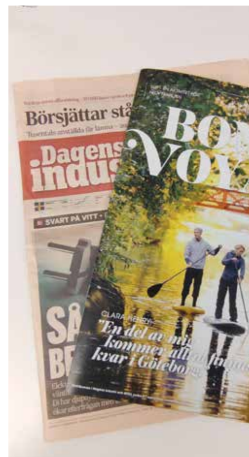
Källa: *Dagens industri Orvesto konsument: 2021 Helår